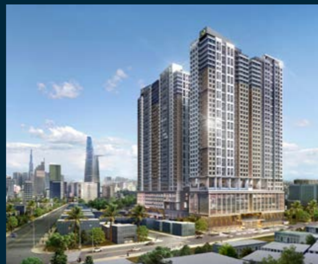
THE GRAND MANHATTAN