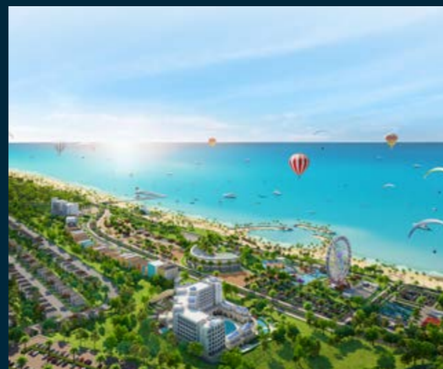
NOVAWORLD PHAN THIET