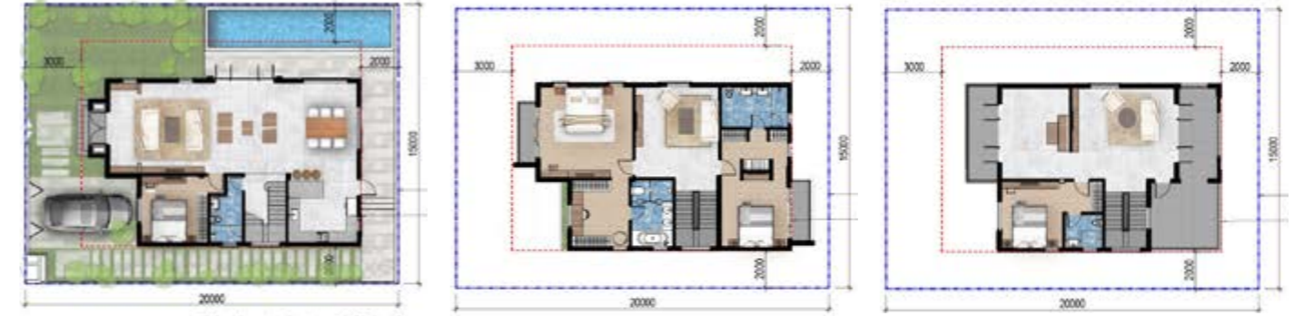
Mặt Bằng Tầng 3

* Mọi thông tin trong tài liệu đúng tại thời điểm phát hành và có thể điều chỉnh mà chủ đầu tư không cần thông báo trước. Bố trí hồ bơi và các tiện ích trong mặt bằng chỉ mang tính chất gợi ý tham khảo.