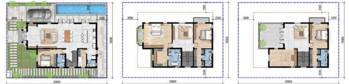
Mặt Bằng Tầng 3

* Mọi thông tin trong tài liệu đúng tại thời điểm phát hành và có thể điều chỉnh mà chủ đầu tư không cần thông báo trước. Bố trí hồ bơi và các tiện ích trong mặt bằng chỉ mang tính chất gợi ý tham khảo.