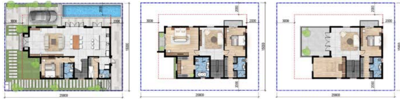
Mặt Bằng Tầng 3

* Mọi thông tin trong tài liệu đúng tại thời điểm phát hành và có thể điều chỉnh mà chủ đầu tư không cần thông báo trước. Bố trí hồ bơi và các tiện ích trong mặt bằng chỉ mang tính chất gợi ý tham khảo.